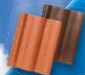
BETÓNOVÁ STREŠNÁ KRYTINA

KOMPLETNÝ SORTIMENT STAVEBNÝCH MATERIÁLOV!