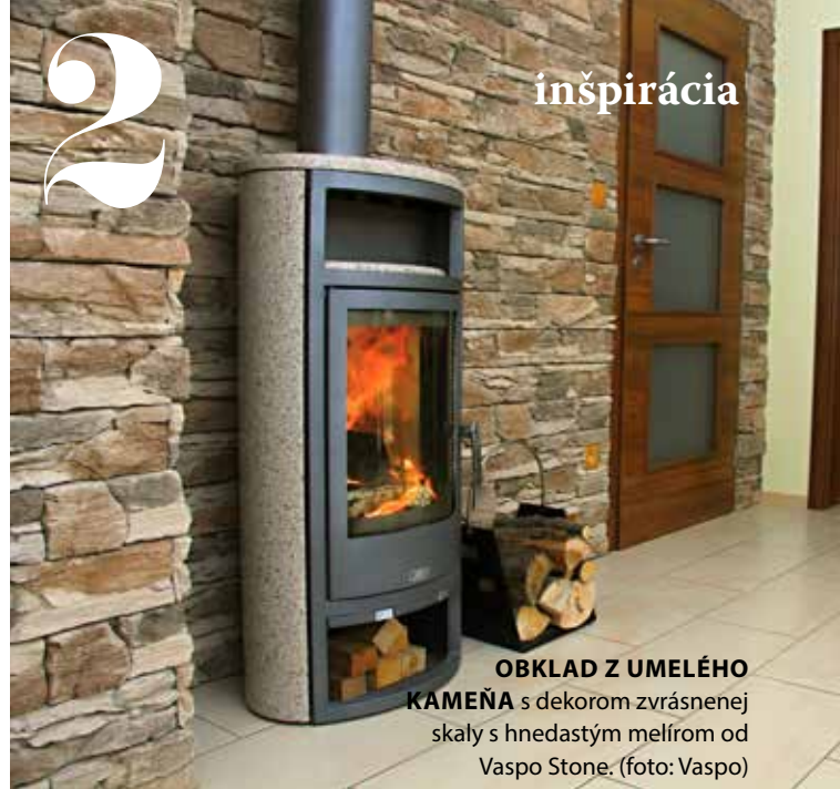
OBKLAD Z UMELÉHO KAMEŇA s dekorom zvrásnenej skaly s hnedastým melírom od Vaspo Stone.