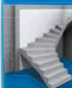
ŽELEZOBETÓNOVÉ PRVKY VYRÁBANÉ NA MIERU

PRVKY PRE INŽINIERKE SIETE A OCHRANU ŽIVOTNÉHO PROSTREDIA